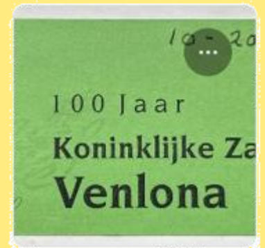
Plakboek van Wim 14 - Aug. 2001 - Dec. 2004